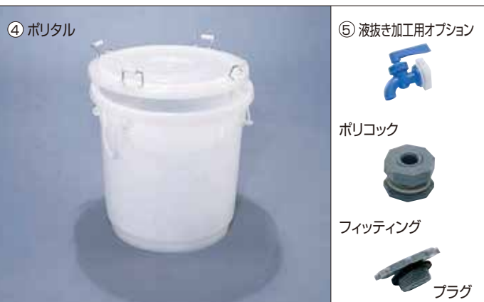
④ ポリタル E-8 直