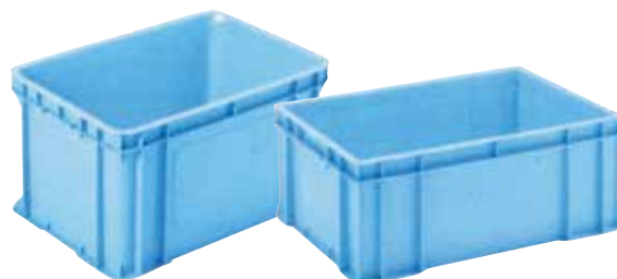
⑥ RBボックス(深型) E-16 直