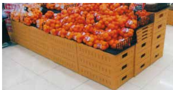
▲ディスプレイオリコン6416を積み上げてその上へ陳列

寸法:600×400×160(55) / 元払:5個 1個 ¥6,700 811-6416