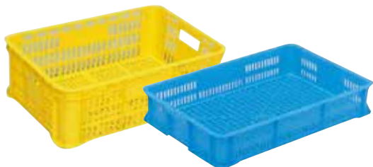
① リステナー(浅型) E-16 直