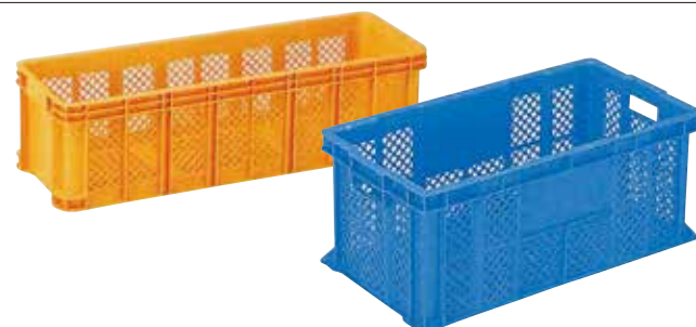
④ サンテナーB(深型・底面格子) E-16 直