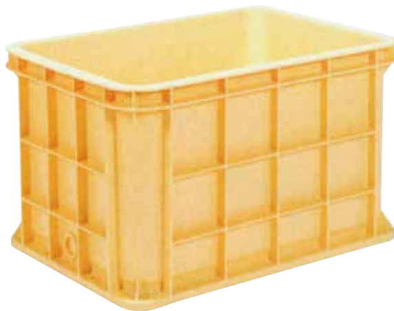
① ジャンボックス E-16 直