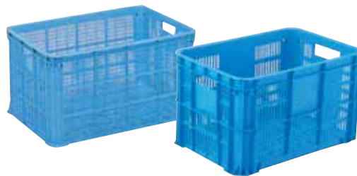
② リステナー(深型) E-16 直