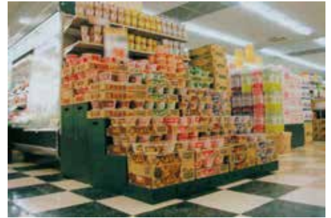
▲組み立て状態と折りたたみ状態とを組み合わせたひな壇のディスプレイ