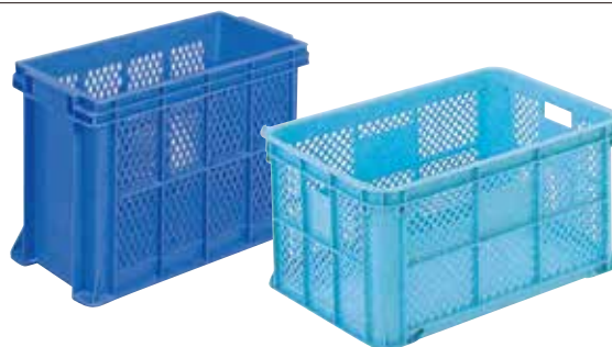
⑥ サンテナーB(深型・底面ベタ) E-16 直