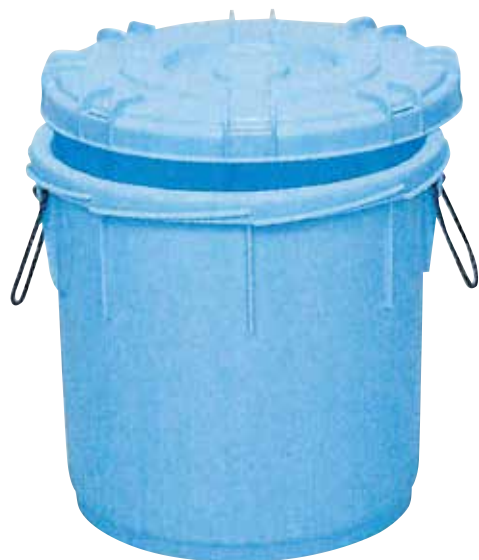
⑥ サンコータル E-16 直