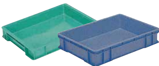
③ サンボックス(浅型) E-16 直