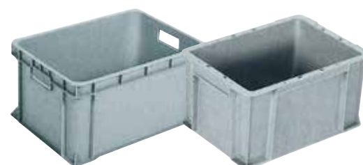
④ サンボックス(深型) E-16 直