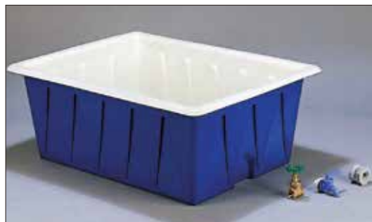
③ 塩水槽 E-8 直