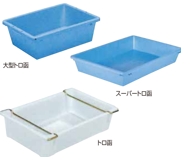
⑧ トロ函 E-16 直