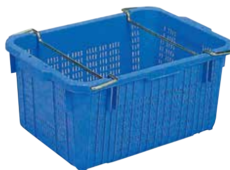
② サンテナーA深型金具付 E-16 直 ハンドル無しあります。