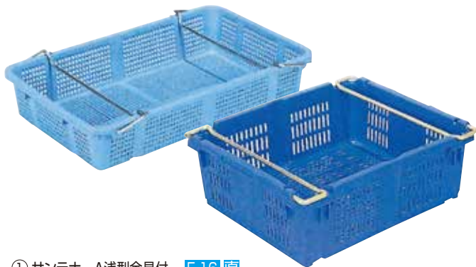
① サンテナーA浅型金具付 E-16 直 ハンドル無しあります。