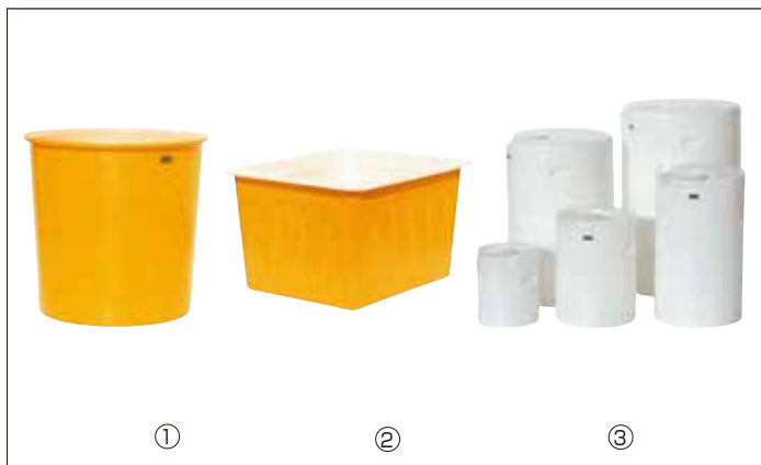
① シンタックスM E-8 直