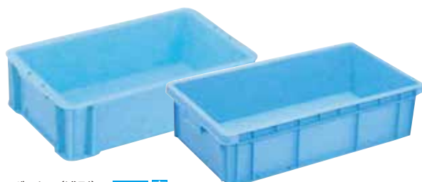
⑤ RBボックス(浅型) E-16 直