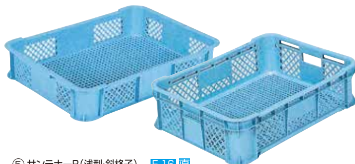
⑤ サンテナーB(浅型・斜格子) E-16 直

材質・PP(#39、#55-1、#55-2) PE(#45、#45-2、#50玉コ、#62、#150)