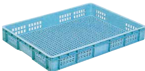
③ サンテナーB浅型 E-16 直