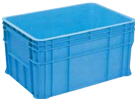
② 大型RBボックス RB-150 E-16 直