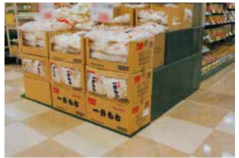
▲フタをスノコとして使用